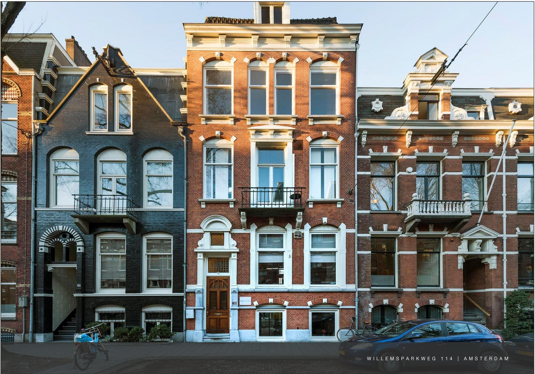
WILLEMSPARKWEG 114 | AMSTERDAM