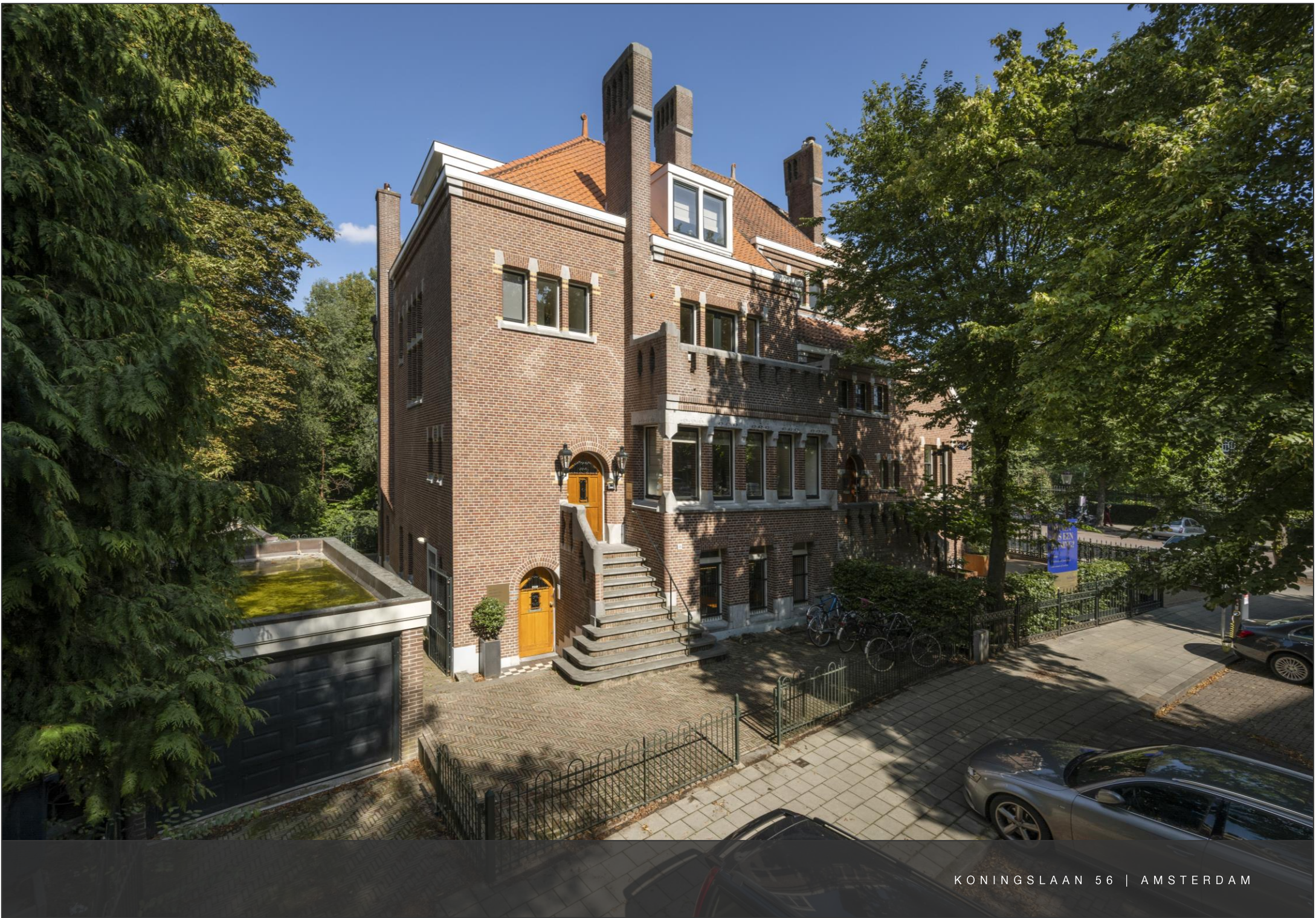
KONINGSLAAN 56 | AMSTERDAM