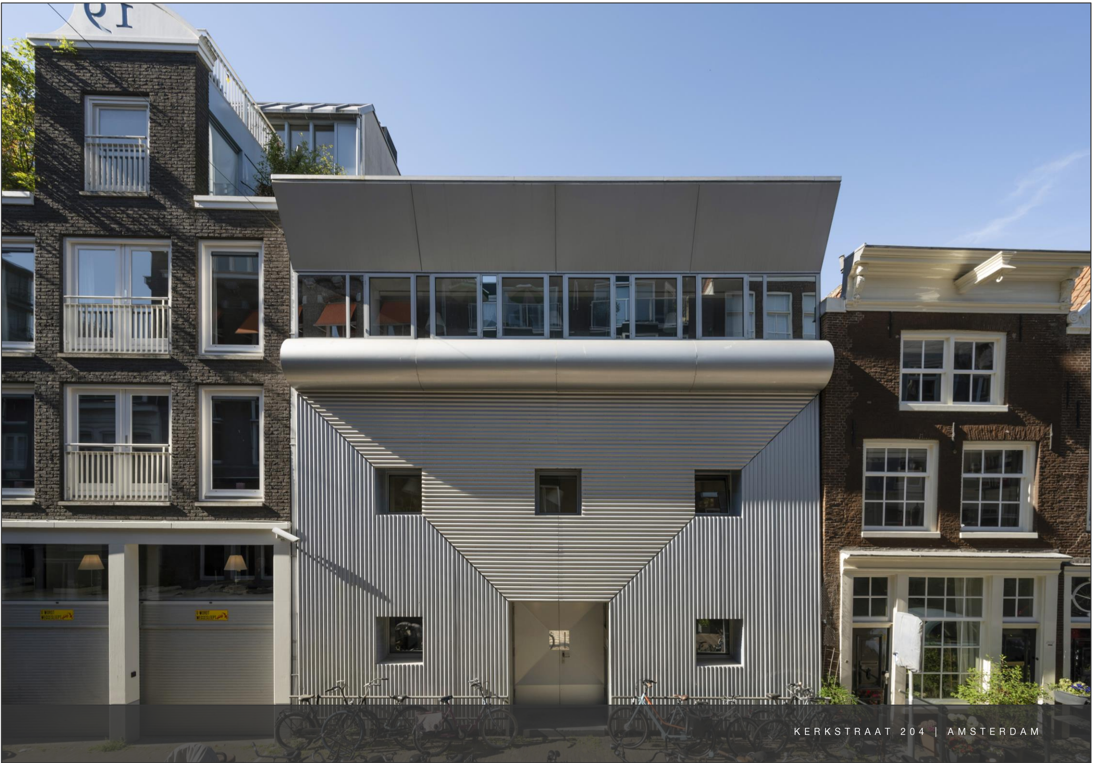
KERKSTRAAT 204 | AMSTERDAM